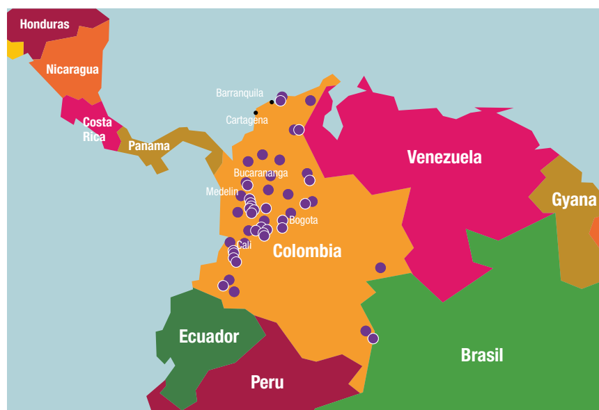
Figura 1 Conflictos ambientales relacionados con la industria extractiva mineral en Colombia